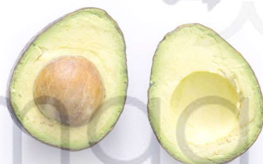
O abacate awokado