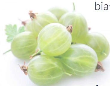
A groselha - branca biała porzeczka