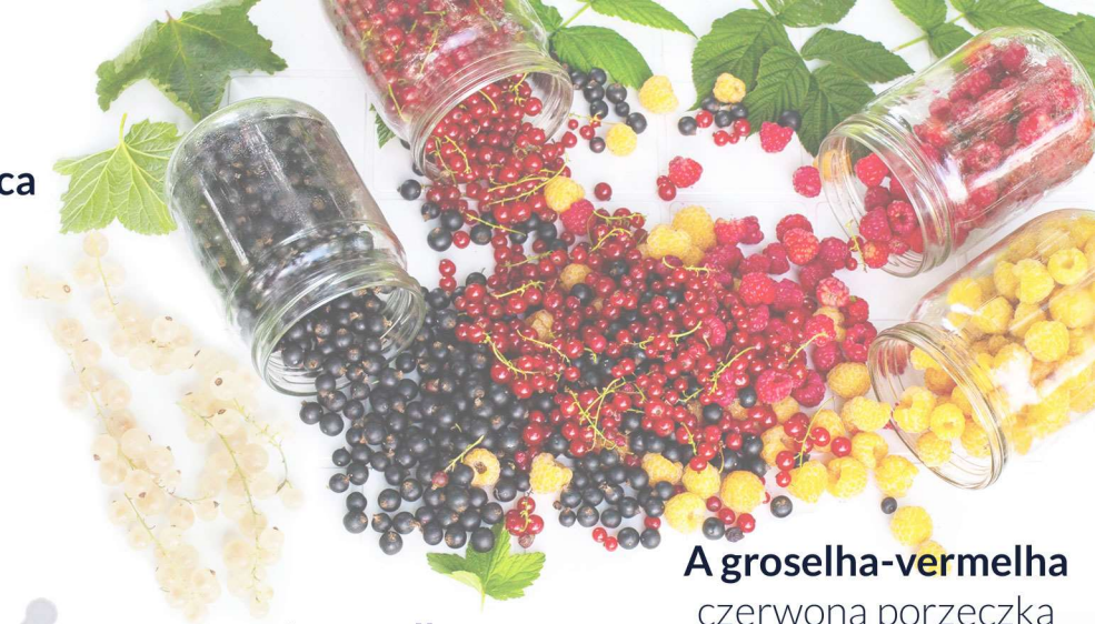
A groselha-vermelha czerwona porzeczka