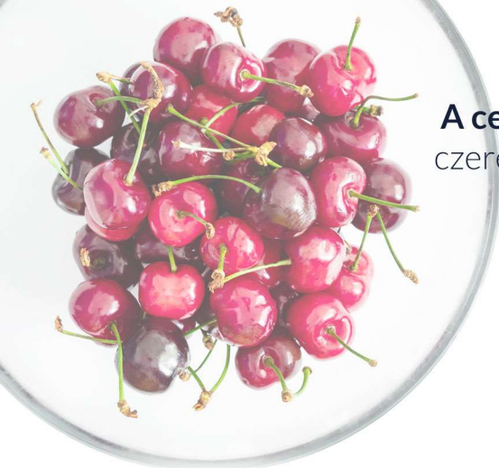
A cereja czereśnia