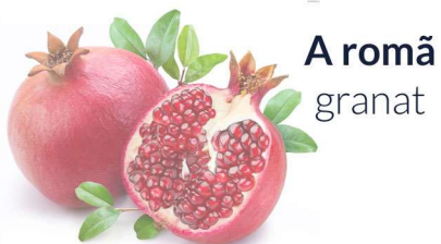
A romã granat