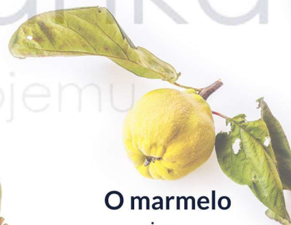
O marmelo pigwa