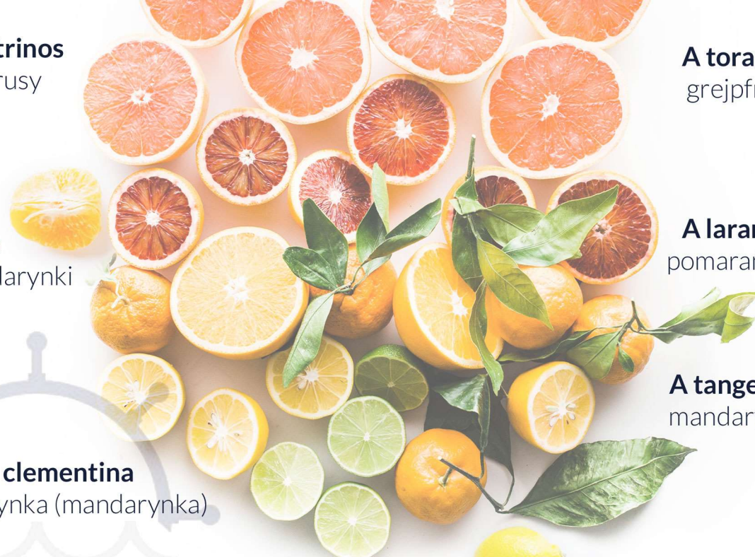
A toranja grejpfrut