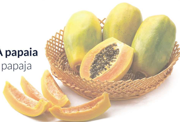
A papaia papaja