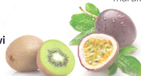
A maracujá marakuja