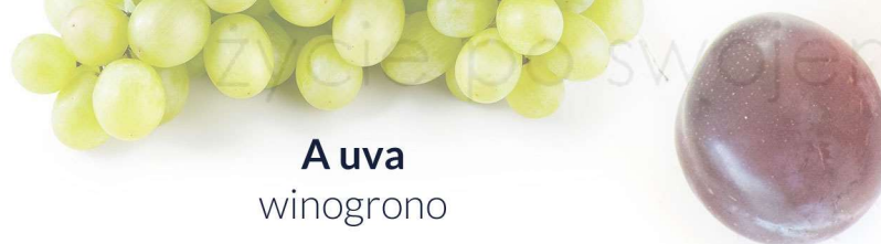
A uva winogrono