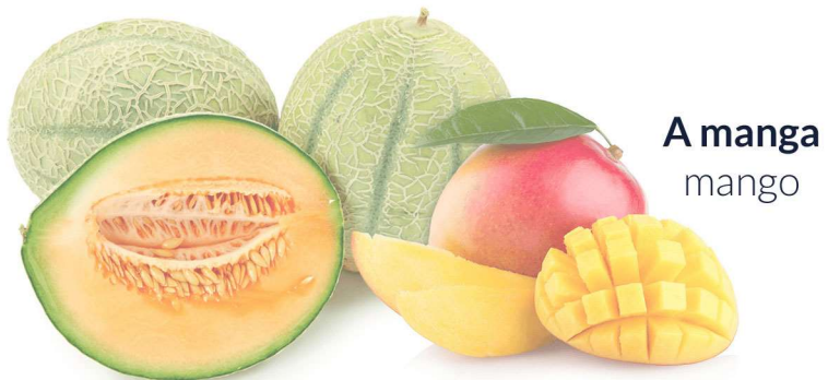
A manga mango