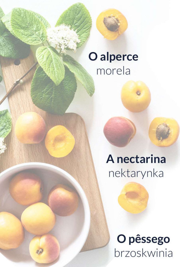
O alperce morela