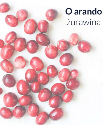
O arando żurawina