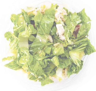
a salada verde sałatka mix sałat