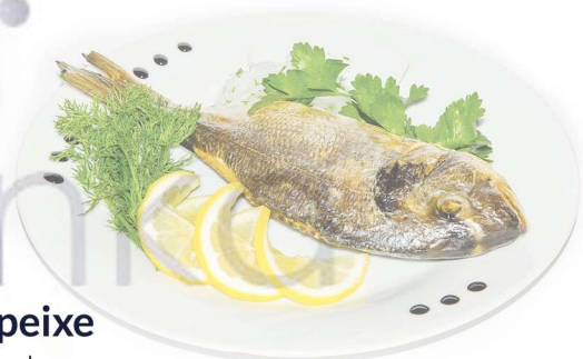
o peixe ryba