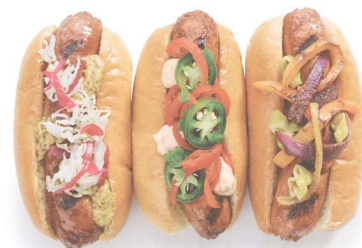
o cachorro - quente hot dog