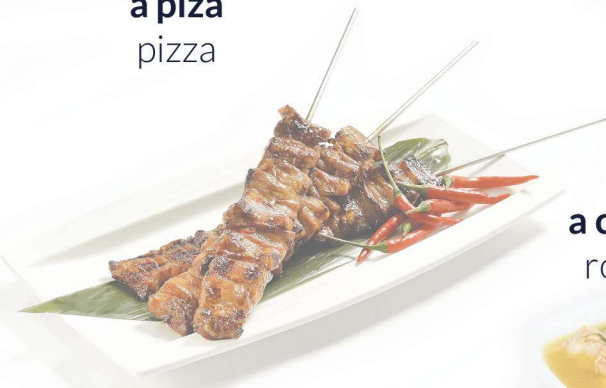
a espetada szaszłyk