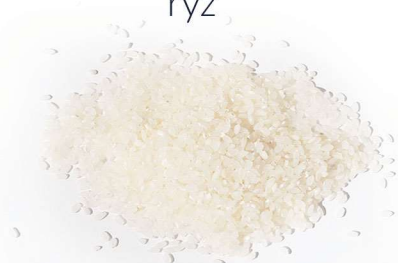
o arroz ryż