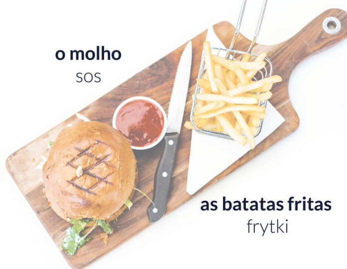
o molho sos