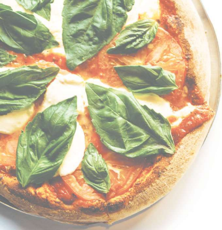
a piza pizza